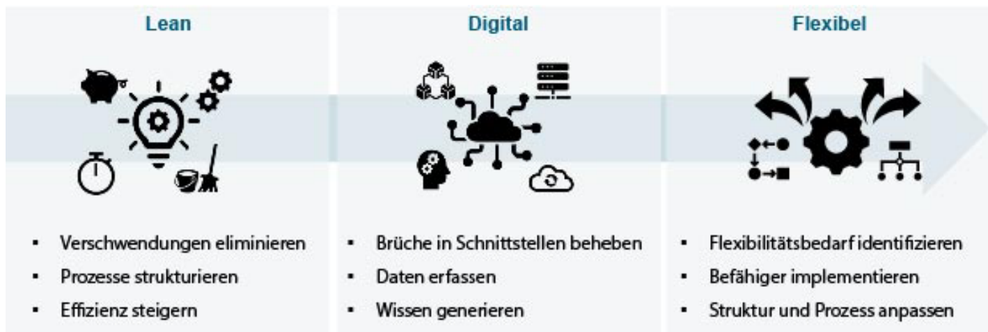
↑ Abbildung 2: Schrittweise zum flexiblen System (© Fraunhofer IWU)

Gerade für KMU sind zudem längere Taktzeiten, ein geringerer Automatisierungs- und Digitalisierungsgrad sowie begrenzte Investitionsfähigkeit typische Rahmenbedingungen, die bei der Konzeption berücksichtigt werden müssen. Zudem greifen eine Vielzahl von Gestaltungsaspekten für Struktur, Steuerung und Vernetzung ineinander und sind hochgradig integriert (vgl. Abbildung 19).