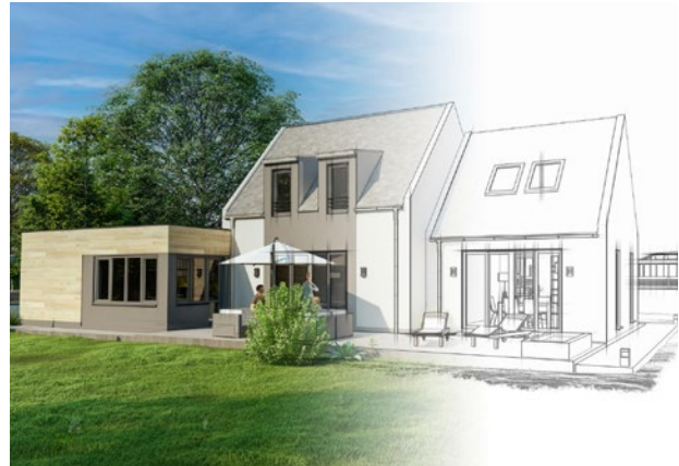
↑ Visualisierung eines Bauprojektes

Im Zuge weiterer Arbeitstreffen wuchs das Wissen im Projektteam und es konnten weitere Anforderungen an mögliche Dienstleister formuliert werden. So zeichnete sich nach und nach ein klares Bild des eigentlichen Arbeitsaufwandes ab.